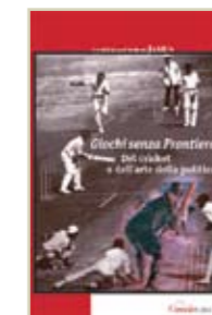
Cyril Lionel Robert James, Giocchi senza frontiere - Del cricket o dell'arte della politica , Casa dei Libri

passione che hanno i brasiliani nei confronti del calcio. Il bello del cricket è anche questo: basta una striscia di venti metri per tre e puoi dire di avere un campo a disposizione. I ragazzini di Antigua, molti dei quali, ahimè, non leggeranno mai C.L.R. James, si lanciano alla conquista di ogni inning con foga incosciente e sincera. Forse è giusto così: le analisi sul retaggio post-coloniale di questa passione sportiva vanno lasciate agli intellettuali come James. Per i ragazzi e per la gente invece, si tratta solo del loro gioco preferito, della loro palestra ludica, del loro campionato privato, della loro riserva di sogni. E se un gioco è riuscito a diventare tutto questo è già un miracolo da tutelare. In questi casi, James sarebbe d'accordo, prima si gioca, e dopo, molto dopo, si capisce il perché.